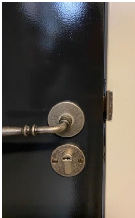
Standaard slot met sluitlip